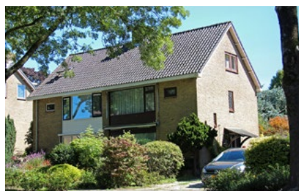
6 Tips voor de woningeigenaar