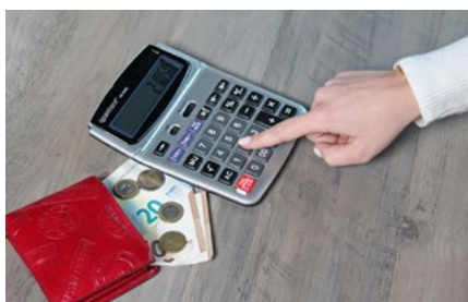
2 Tips voor de ondernemer in de inkomstenbelasting