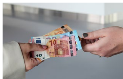
4 Tips voor werkgevers