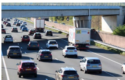
5 Tips voor de automobilist