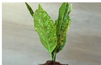
8 Verduurzaming en klimaat