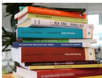
5 Subsidies en tegemoetkomingen