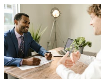
4 Tips voor werkgevers