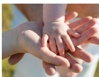
1 Tips voor alle belastingplichtigen

Een aantal plannen van het kabinet is nog niet definitief. Deze moeten nog door de Eerste Kamer worden goedgekeurd. Welke dat zijn, kunnen wij u uiteraard vertellen. Ook worden nog steeds nieuwe plannen bekendgemaakt of worden er huidige plannen aangepast. Daarom overleggen wij graag met u of het verstandig is wel of geen stappen te zetten.