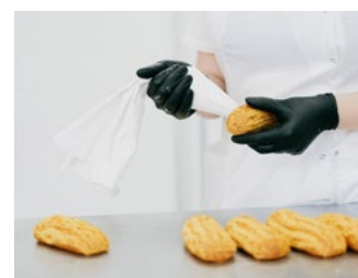
8 Tips inzake belasting-schulden coronacrisis en/of huidige (energie)crisis