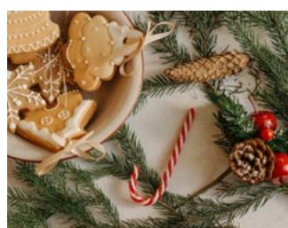
3 Tips voor de bv en de dga