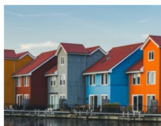
6 Tips voor de woningeigenaar