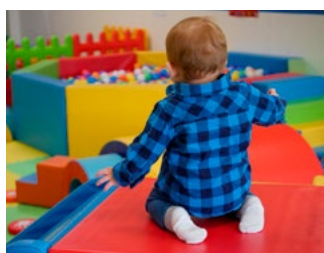
7 Overige, eerder aangekondigde en te verwachten voorstellen

Deze special bevat voorstellen van het kabinet die de komende periode in het parlement worden behandeld. De voorgestelde maatregelen treden per 1 januari 2022 in werking, tenzij anders is vermeld.